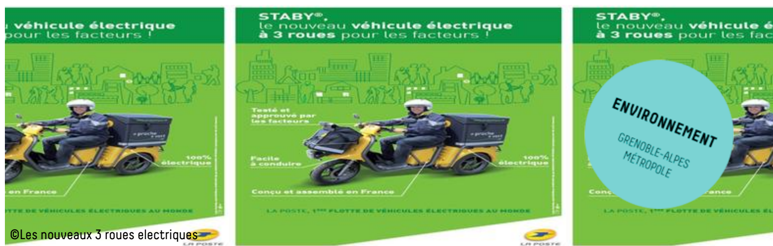
©Les nouveaux 3 roues électriques